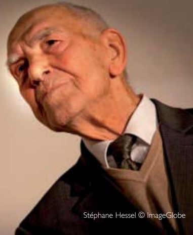
Stéphane Hessel

Stéphane Hessel werd geboren in Duitsland, maar draagt Frankrijk in zijn hart (vandaar zijn beslissing op twintigjarige leeftijd om zich tot Fransman te laten naturaliseren). Hessel zag in 1917 het levenslicht in Berlijn. De kaart van Europa stond al vroeg getekend in de palm van zijn hand. Net als Robert Schuman en Jean Monnet, werd Stéphane Hessel in zijn kindertijd heen en weer geslingerd tussen Frankrijk en Duitsland, totdat de oorlog begon. Zijn leven lang blijft Hessel hierdoor getekend, getuige hiervan zijn Europese engagement.