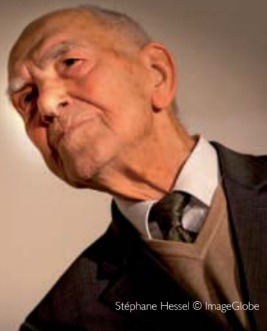
Stéphane Hessel

Allemand de naissance, Français de cœur et d'alliance (choisissant dès ses 20 ans d'être naturalisé français), Stéphane Hessel est né en 1917 à Berlin, la carte de l'Europe dessinée sur la paume des mains. Comme Robert Schuman, comme Jean Monnet, Stéphane Hessel a vu son enfance zigzaguer entre la France et l'Allemagne jusqu'à ce que ces nations ne tombent dans la guerre et ses tranchées. Toute la vie de Stéphane Hessel, à commencer par son engagement européen, restera marquée par cet itinéraire singulier.