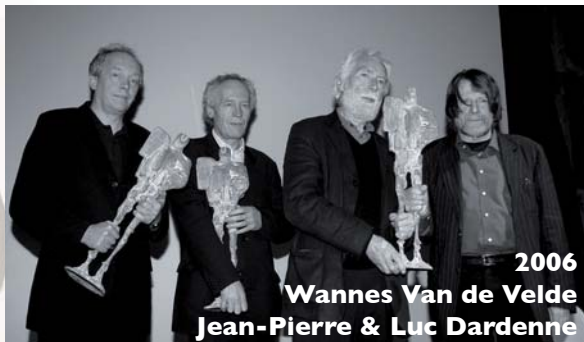
2006 Wannes Van de Velde Jean-Pierre & Luc Dardenne