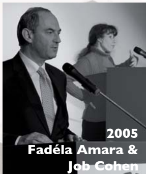
2005 Fadéla Amara & Job Cohen